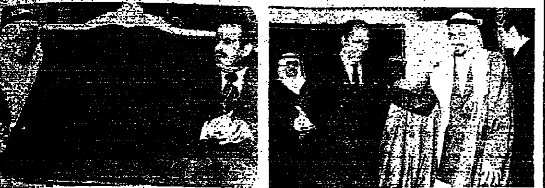
الملك خالد والرئيس السادات